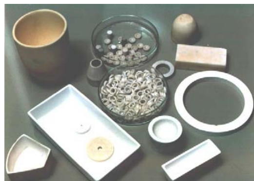
Cerámicos de alta alúmina