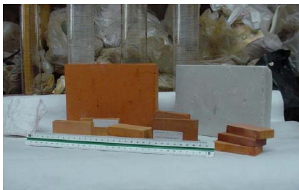
Cerámicos obtenidos en base a diatomeas

Análisis de propiedades físicas y, obtención de productos de interés industrial a partir de diatomeas.