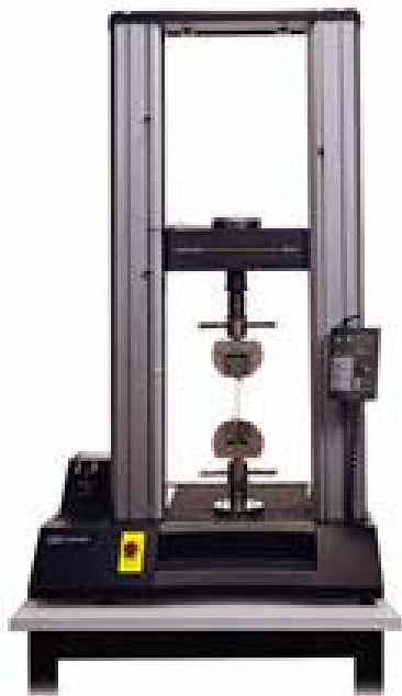
Máquina de ensayos mecánicos INSTRON 5567

La espectroscopia mecánica y la fricción interna constituyen otras técnicas de importancia para el estudio de materiales. En el grupo, éstas se aplican para el estudio de materiales absorbedores de hidrógeno, de electrodos para baterías de H y caracterización de capas de NiTi sobre sustratos de Cu y aceros.