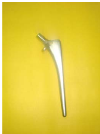
Apéndice femoral de una prótesis de Cr-Co-Mo