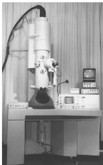
Microscopio electrónico de transmisión PHILIPD CM200 Utratwin