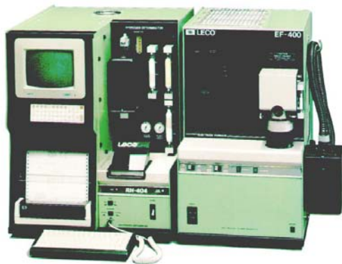
Analizador de Hidrógeno LECO

Hay trabajos de colaboración con el INIFTA (La Plata), la Universidad Nacional del Comahue, la Universidad Nacional de Cuyo, y Venezia Technologie (Italia)