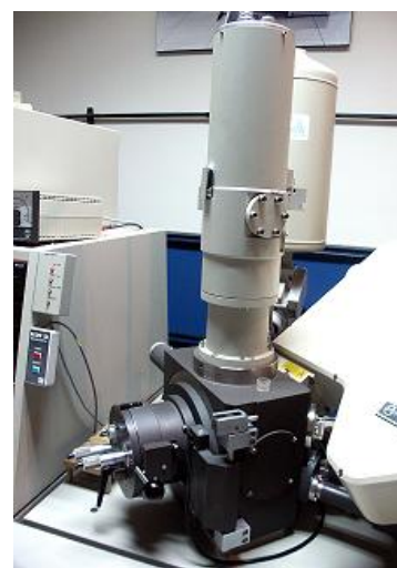
Microscopio Electrónico de Barrido (SEM) Philips 515

Cuenta con equipos y personal capacitado que permiten ofrecer el servicio de análisis por difracción de rayos X en baja y alta temperatura ( -196 \leq T \leq 1000 \text{ }^\circ\text{C} ) y de microscopía electrónica de barrido (SEM) con detectores EDS y WDS. Este servicio se brinda a todos los sectores del Centro Atómico Bariloche y también como servicio a terceros (Universidades, Empresas, Poder Judicial).