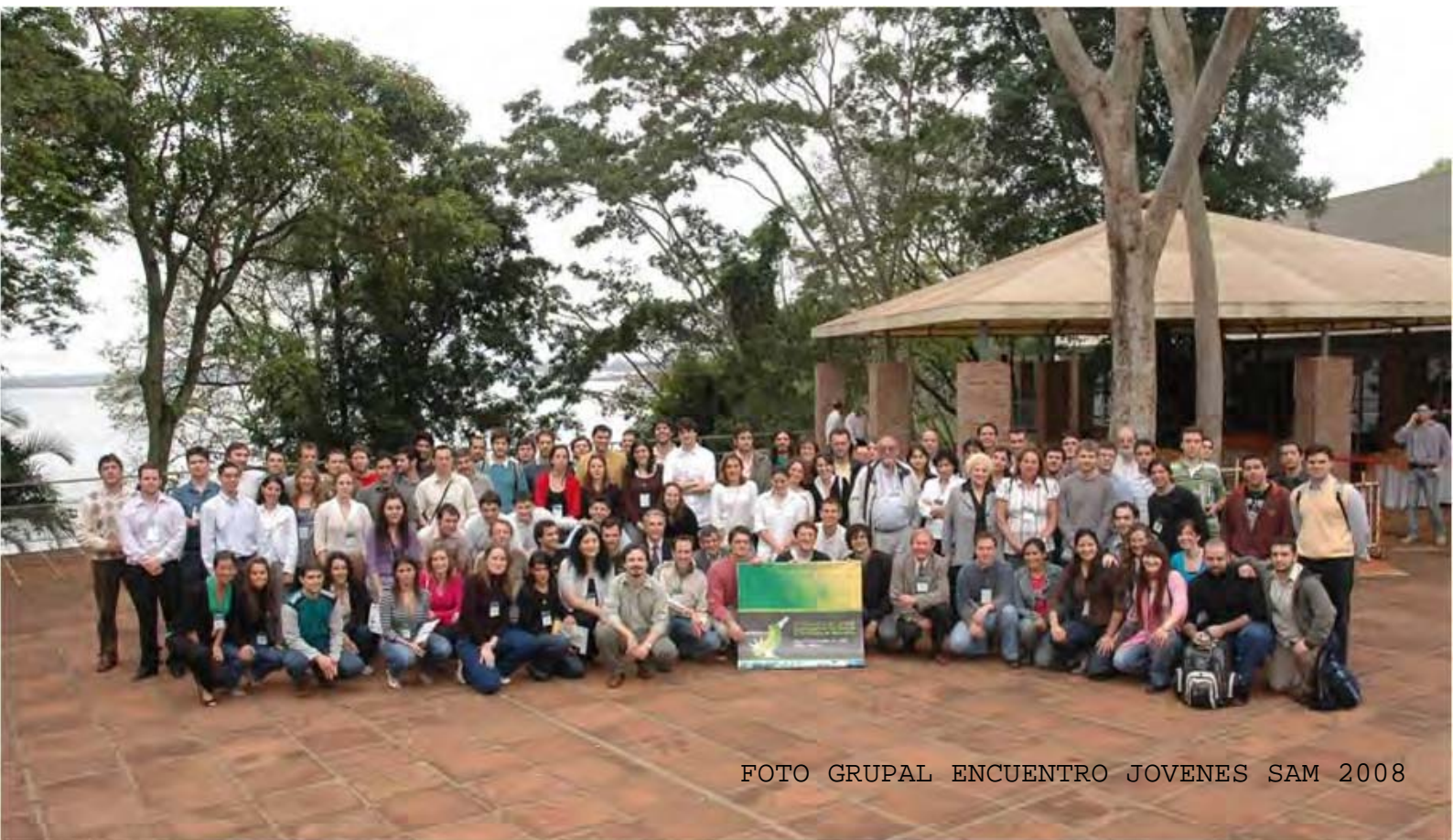
FOTO GRUPAL ENCUENTRO JOVENES SAM 2008