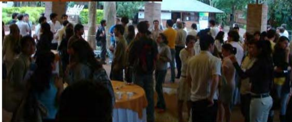
CAFÉ - INTERCAMBIOS