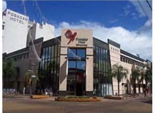
POSADAS - MISIONES